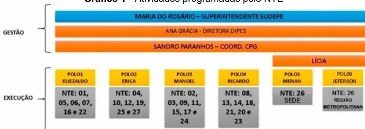
Gráfico 1 - Atividades programadas pelo NTE