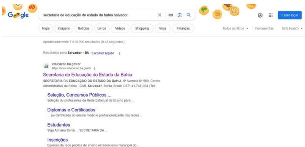
Figura 1 – Alternativa de acesso ao Secretaria de Educação do Estado da Bahia

momentos pelo notebook conectado à rede wi-fi de Internet. Uma alternativa para acessar o Portal da Secretaria de Educação do Estado, é fazendo uma busca rápida no Google, caso não tenha o endereço eletrônico do Portal, é pesquisar por: “Secretaria de Educação do Estado da Bahia”. Na figura 1 aparece no topo dos resultados da pesquisa, mais de 7. 810.000 resultados em 0,48 segundos, acesso em 12 de julho às 18:21, conforme imagem abaixo, a qual já disponibiliza um pequeno resumo das informações que serão encontradas no Portal.