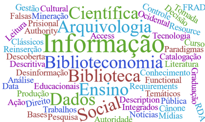
Figura 1 - Temáticas mais recorrentes a partir das palavras-chave dos TCC