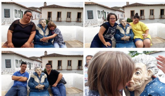
Figura 2 – Estátua em homenagem a escritora Cora Coralina 3