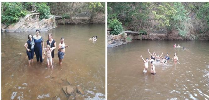
Figura 3 – Rio Vermelho 4