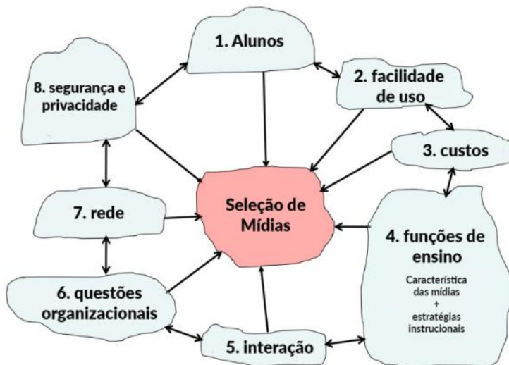
Figura 1- Modelo SECTIONS para Seleção de Mídias

“[...] passam a condicionar as instituições que regulam nosso aprendizado, nossa formação cognitiva, afetiva, psicológica, portanto, nossas percepções sobre o mundo” (Setton, 2010, p. 24).