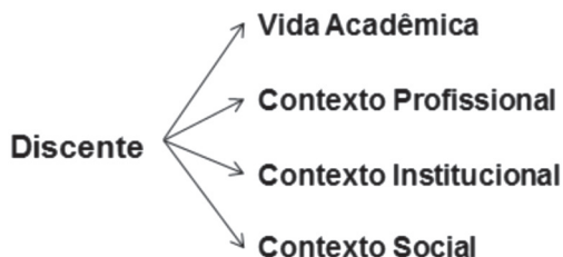
Figura 3: Avaliação do corpo discente.

Igualmente partindo do pressuposto da indissociabilidade entre o ensino, a pesquisa e a extensão, observaram-se como parâmetros importantes, a participação do discente na universidade/curso; a atuação do discente no mundo do trabalho; o discente e o contexto institucional e, finalizando, o discente e o contexto social.