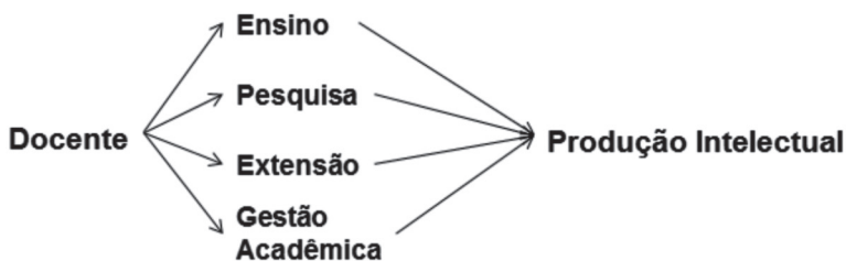
Figura 2: Avaliação do corpo docente.