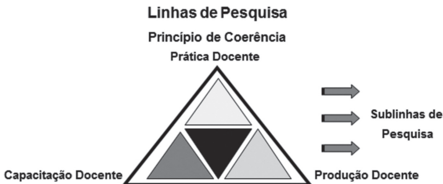
Figura 1: Princípio de Coerência